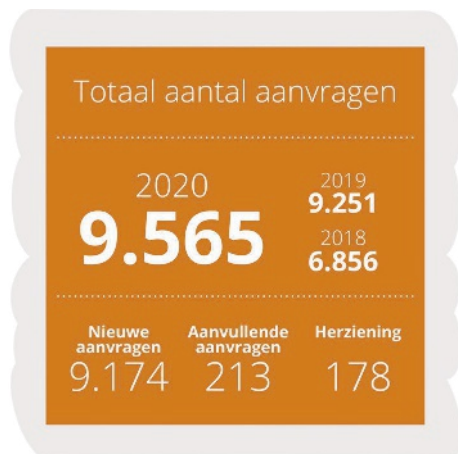
Figuur 11.1 Totale aantal aanvragen en overige aanvragen